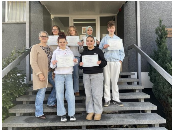
International anerkanntes DELF-Zertifikat Niveau A2 für die Schüler*innen der Klasse 10

Wir gratulieren allen Französisch-Schüler*innen herzlich!