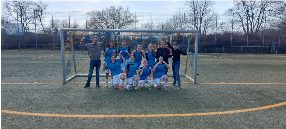
Wir gratulieren den Mädchen U17 zur Kreismeisterschaft!