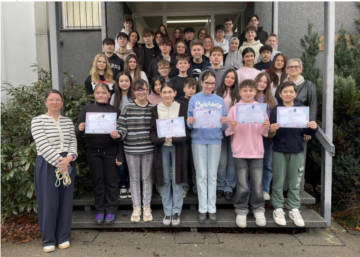
Erfolgreiche Teilnahme am bundesweiten Teamtag Französisch der Jahrgangsstufen 6 – 10 im Januar 2026